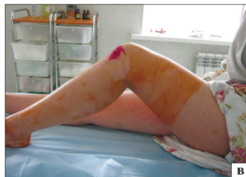
Рис. 1. Фото больных на этапах реабилитации после артроскопических операций: а, б) занятия на тренажерах — 1 мес. после операции; в) движение в суставе в 1 сутки после операции