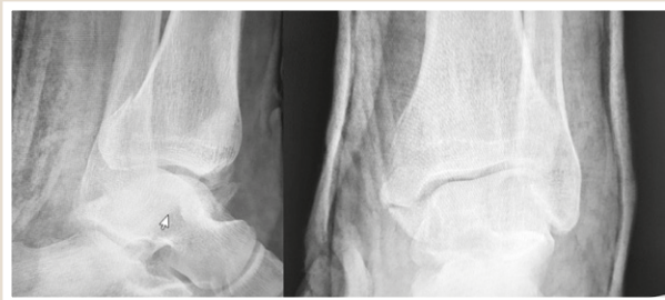
Рис. 2. Фотовідбитки з рентгенограми хворого Ж. перед операцією.