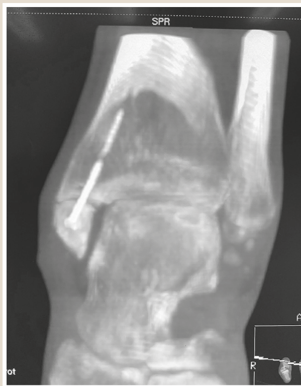
Рис. 6. КТ над'яtkово-гомiлковогo суглоба хворого Ж., 5 тижень після операції.

діаметром 3,5 мм, що виготовлений із модифікованого біорезорбційного магнієвого сплаву MC-10.