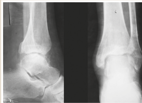
Рис. 5. Фотовідбитки з рентгенограми хворого Ж. на 25 тижнів після операції.