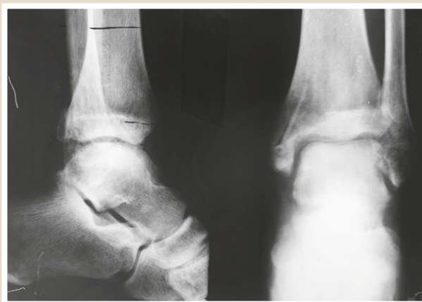
Рис. 4. Фотовідбитки з рентгенограми хворого Ж. через 8 тижнів після операції.