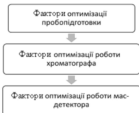
Рис. 2. Фактори оптимізації в ВЕРХ-МС

Фактори оптимізації в ВЕРХ-МС можна розділити на три групи (рис. 2).