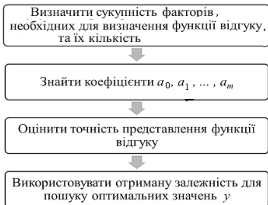
Рис. 4. Етапи створення та використання моделі

Планування експерименту залежить від рішення чотирьох завдань (рис. 4).