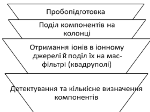
Рис. 1. Стадії експерименту в хромато-мас-спектрометрії

У хромато-мас-спектрометрії можна виділити чотири стадії експерименту (рис. 1.)