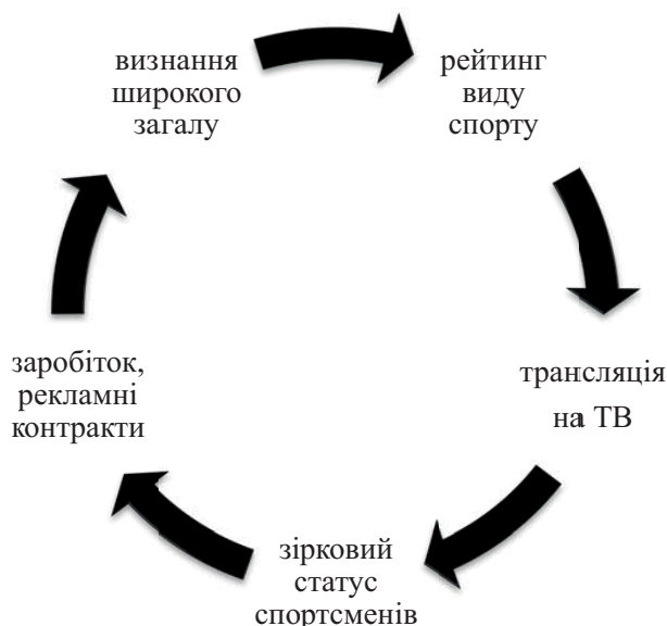
Рис.1.1. Схема формування популярності виду спорту в зв'язку із впливом чинників глобалізації

залежності та фактично не мають можливості не залежати від процесів глобалізації.