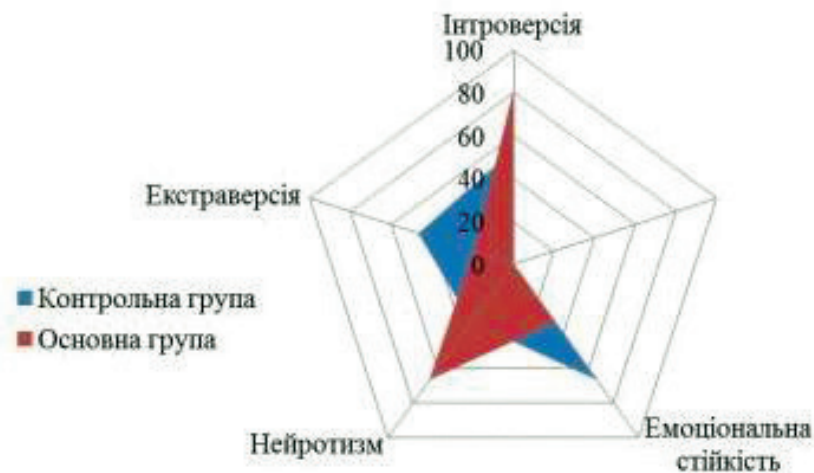
Рис. 1. Особистісна характеристика жінок з перименопаузальними порушеннями та без клімактеричного синдрому