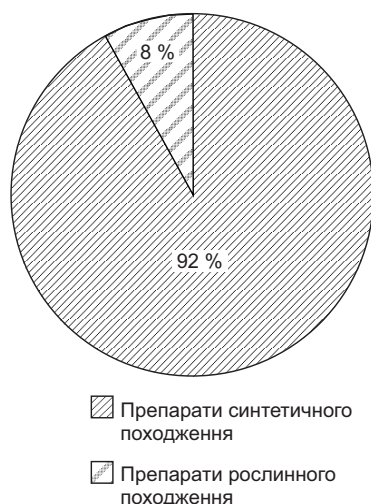
Рис. 1 Розподіл асортименту групи N06BX за походженням діючих речовин

Як видно з даних таблиці, для групи цитиколіну характерні такі лікарські форми: розчини для ін'єкцій – 55 %, таблетки – 20 %, краплі для орального застосування – 1 %; для групи вінпоцетину – таблетки 23,5 %; для групи пірацетаму – таблетки 21,3 %, розчини для ін'єкцій 22,5 %; для групи фенібуту – таблетки 10,6 %; для мебікару – таблетки 7,1 %; для рослинних препаратів, які представлені лише препаратами Гінкго Білоба, основну питому вагу займають таблетки – 52,6 %.