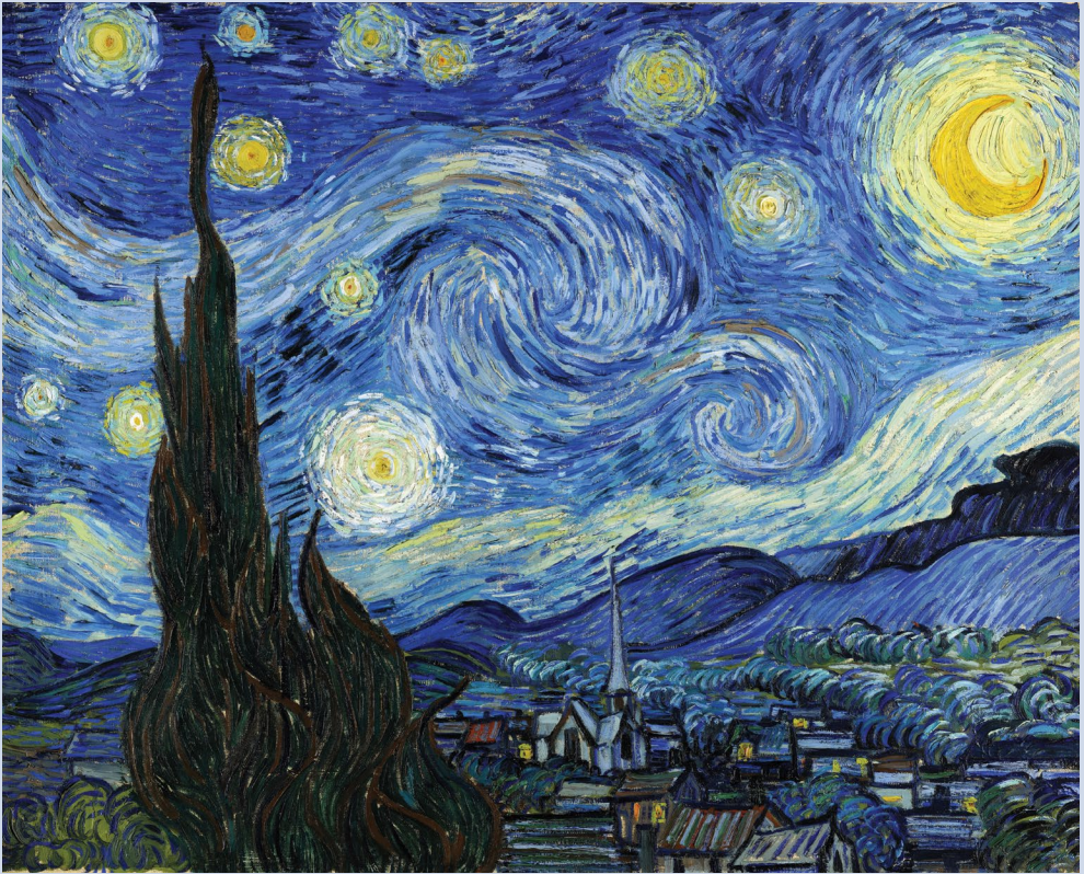
Винсент Ван Гог, «Звездная ночь» (1889)