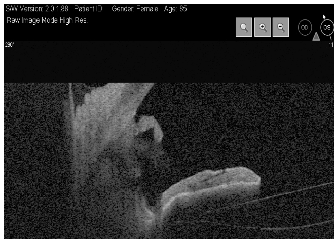
Рис. 1. Оптическая когерентная томография переднего отрезка глаза. Положение дренажа в супрахориоидальном пространстве: один конец дренажа в передней камере, другой – в супрахориоидальном пространстве.

Катарактальный и антиглаукоматозный компонент операции выполняли через общий доступ. Первый этап – факоэмульсификация катаракты с имплантацией интраокулярной линзы через роговичный туннельный разрез длиной 2,75 мм. После удаления катаракты и имплантации интраокулярной линзы в капсульный мешок переходили к предложенному нами модифицированному способу хирургической активации увеосклерального оттока путем имплантации коллагенового дренажа Ксенопласт (ДКА). На 6 часах шпателем разрушали трабекулярную сеть, выполняли гидродиссекцию супрахориоидального пространства и вискодиализ цилиарного тела. После этого один конец пористого дренажа Ксенопласт погружали под цилиарное тело в направлении к супрахориоидальному пространству, а другой оставляли в передней камере (рис. 1).