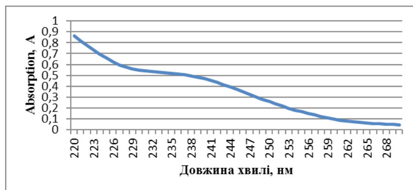
Fig. 3. UV spectrum of PSS of L-lysine 3-methyl-1.2.4-triazole-5-thioacetate