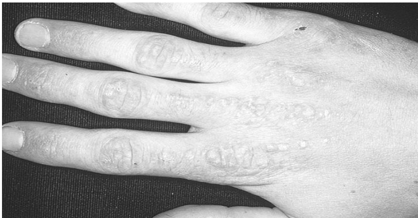
Рис. 3. Симптом Готрона.

Характерна ознака ДМ: «геліотропний» набряк параорбітальної ділянки, еритема шкіри обличчя і в зоні «декольте», еритематозні полушени висипання над дрібними суглобами кистей (симптом Готрона (Рис.3)).