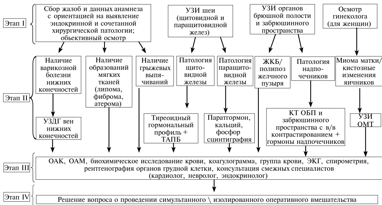
Рис. 1. Способ диагностики сочетанной хирургической патологии у пациентов с заболеваниями эндокринной системы.

анализ крови (ОАК) и мочи (ОАМ), биохимическое исследование крови (креатинин, мочеви́на, калий, натрий), коагулограмму, определение группы крови, электрокардиографию (ЭКГ), спирометрию, рентгенографию органов грудной клетки, консультации смежных специалистов (кардиолог, невролог, эндокринолог).