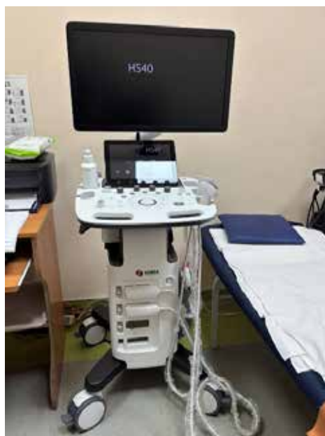
Рис. 1. Апарат ультразвукової діагностики Samsung HS 40 Fig. 1. Samsung HS 40 ultrasound diagnostic device

All subjects underwent ultrasound examination of facial soft tissues on the day of hospitalization using a Samsung HS 40 device (Fig. 1) with a sensor frequency of 10 MHz in B-mode and in color Doppler mapping (hereinafter referred to as CDM) mode to assess blood supply in the studied area.