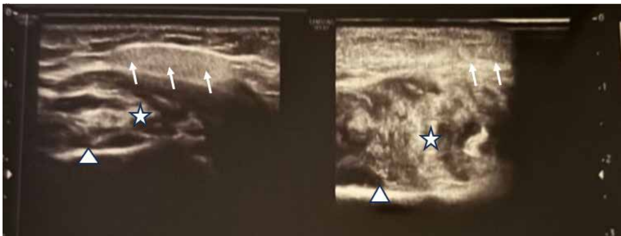
Рис. 2. Ехокартина м'яких тканин здорової (фото ліворуч) та патологічної (фото праворуч) білявушно-жувальної ділянки пацієнтки С. у сагітальній проекції

In Fig. 3, black arrows indicate the maxillohyoid muscle. White square – the anterior abdomen of the left digastric muscle. More proximally, at a depth of 13 mm, a homogeneous hypoechoic oval-shaped formation with fuzzy, uneven contours (white star), measuring 21×14 mm, is determined. The surrounding soft tissues are of increased echogenicity. Due to the absence of hyperechoic inclusions (fibrin threads, detritus, putrefactive soft tissues), the cavity was interpreted as an inflammatory infiltrate or accumulation of serous exudate. During surgical treatment, the cavity was opened and drained, more than 5 ml of putrefactive exudate was obtained.